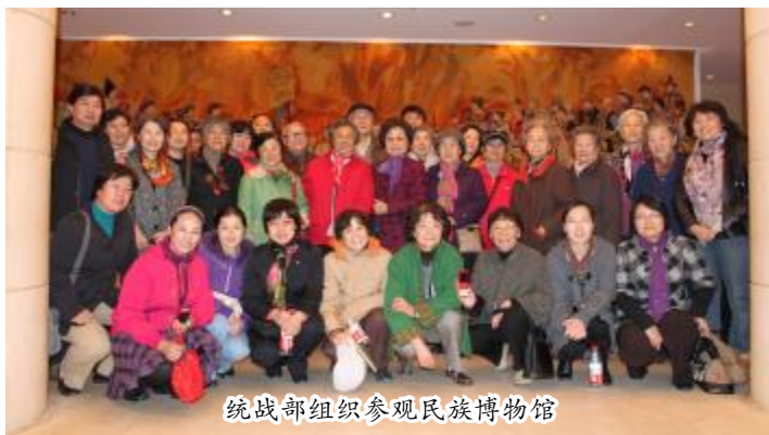
统战部组织参观民族博物馆