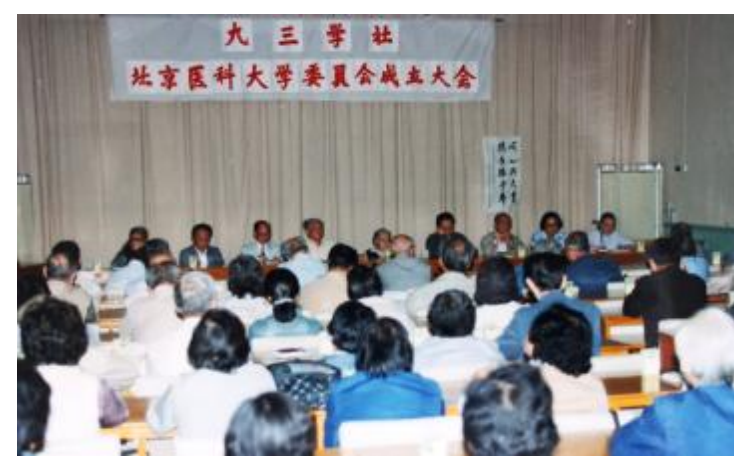
九三学社北京医科大学委员会成立大会 (1989年)