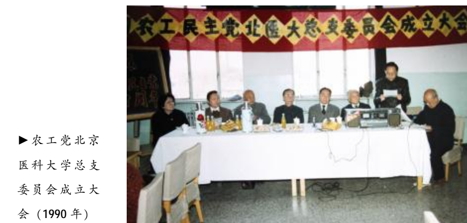
农工党北京医科大学总支委员会成立大会 (1990年)