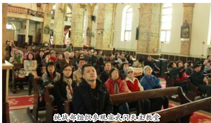
统战部组织参观宣武门天主教堂

间为少数民族学生发放了伙食补助。近年来，医学部党委选派多名业务骨干赴新疆、西藏等地，支持少数民族地区医疗卫生事业的发展。人民医院、第一医院先后获得首都民族团结进步奖。