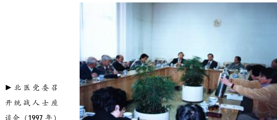
北医党委召开统战人士座谈会 (1997年)