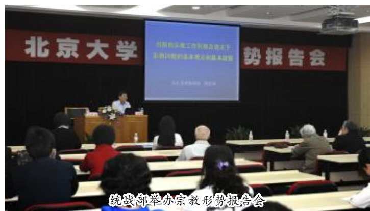
统战部举办宗教形势报告会

医学部党委高度重视民族宗教工作，成立了北京大学医学部民族宗教工作领导小组，认真贯彻落实党的民族宗教政策，关心少数民族师生的工作、学习和生活，组织少数民族教职员工参观宣武门天主教堂、牛街伊斯兰教礼拜寺，每逢开斋节期