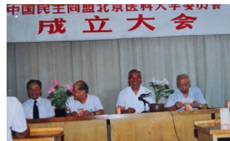
民盟北京医科大学委员会成立大会 (1992年)