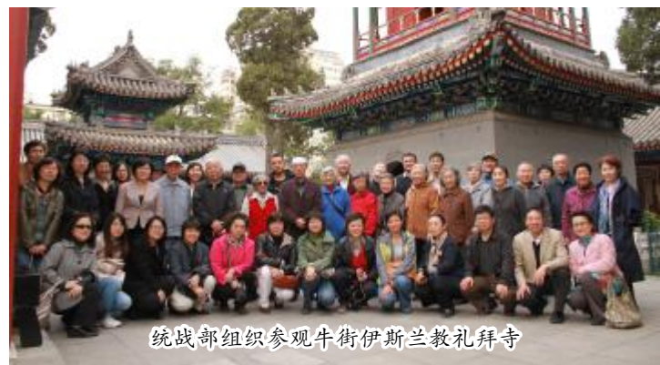
统战部组织参观牛街伊斯兰教礼拜寺

间为少数民族学生发放了伙食补助。近年来，医学部党委选派多名业务骨干赴新疆、西藏等地，支持少数民族地区医疗卫生事业的发展。人民医院、第一医院先后获得首都民族团结进步奖。