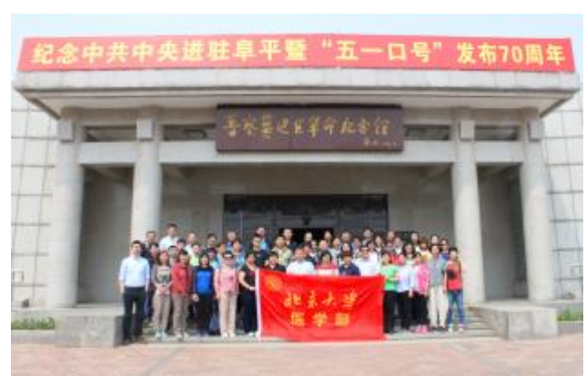
统战部举办民主党派新成员研修班