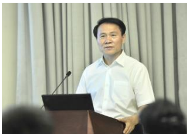
北京大学常务副校长、医学部主任唐启敬出席医学部侨联归国留学人员创新论坛并致辞