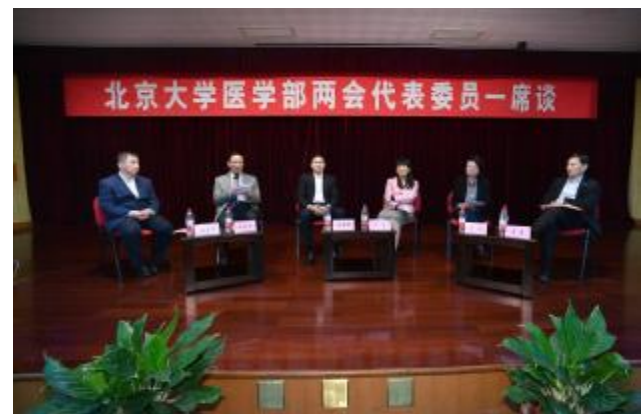
医学部党委举办两会代表委员一席谈活动