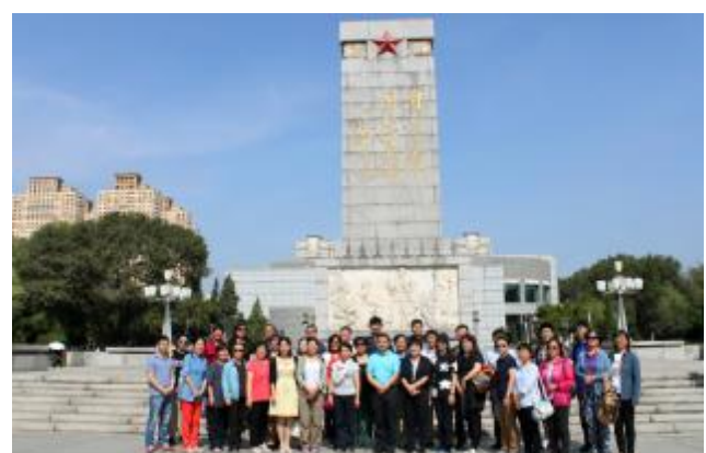
统战部组织统战人士赴沈阳异地教学