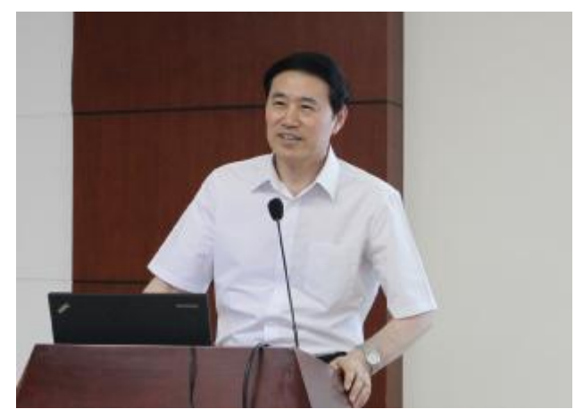
北京大学党委副书记、医学部党委书记刘玉村为统战人士介绍北大医学建设情况