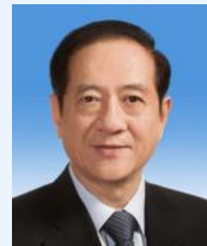
韩启德 九三学社 中国科学院院士