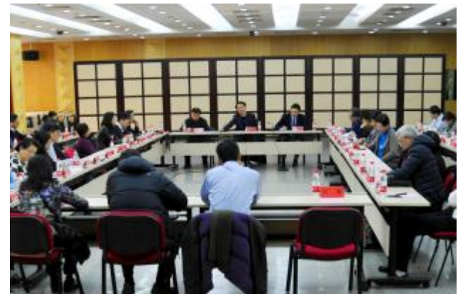
医学部党委召开统战人士座谈会