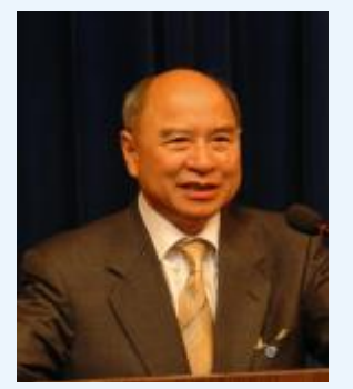
陆道培 农工党 中国工程院院士