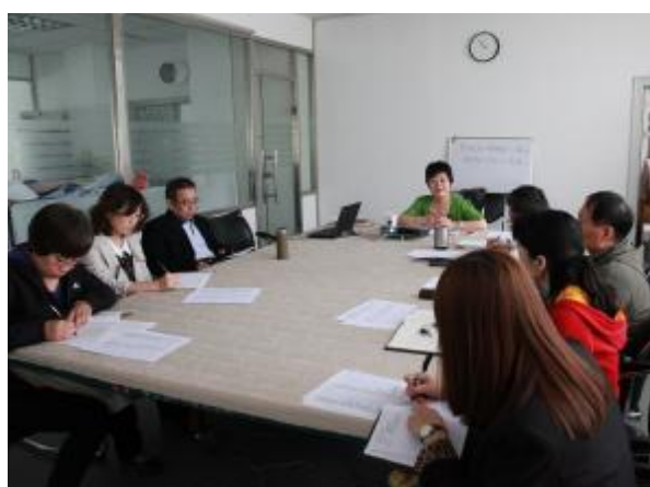
▲产业党总支邀请统战人士参加党支部生活