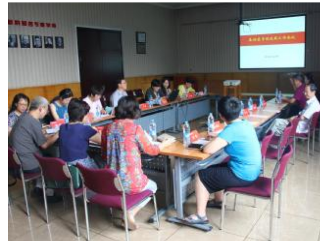
▲基础医学院召开统战工作会议