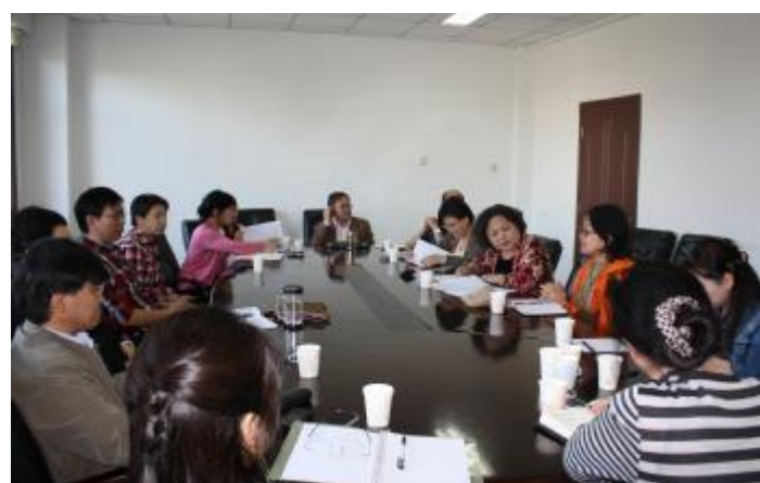
▲机关党委召开统战人士座谈会