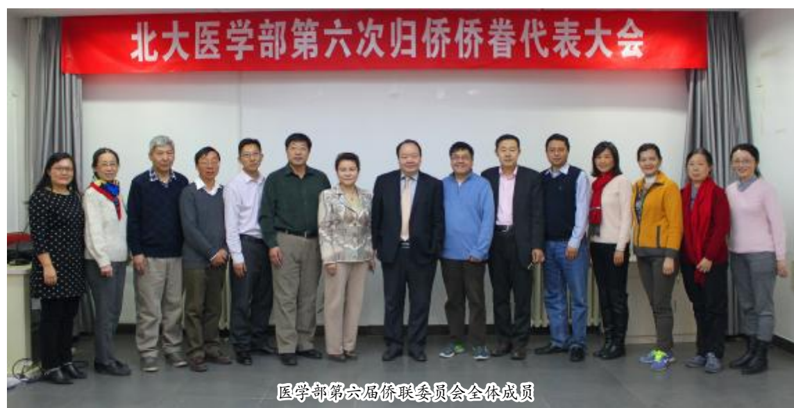
医学部第六届侨联委员会全体成员