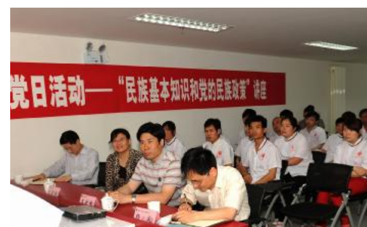
▲后勤党委举办“民族基本知识和党的民族政策”讲座