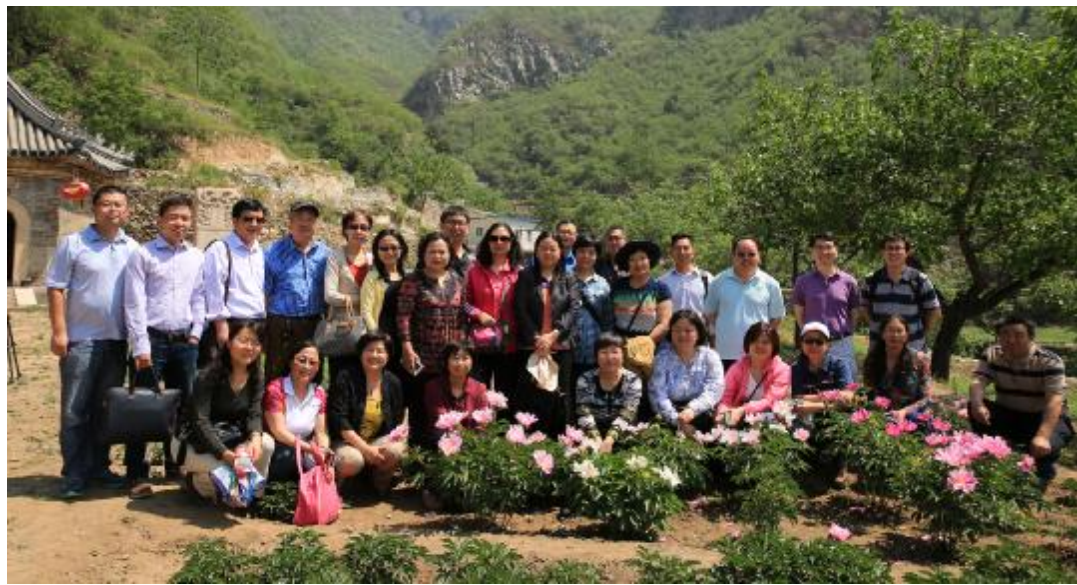
▲口腔医院组织统战人士参观学习