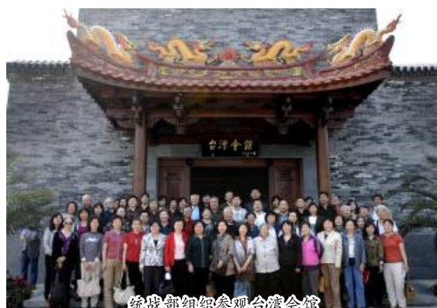
统战部组织参观台湾会馆