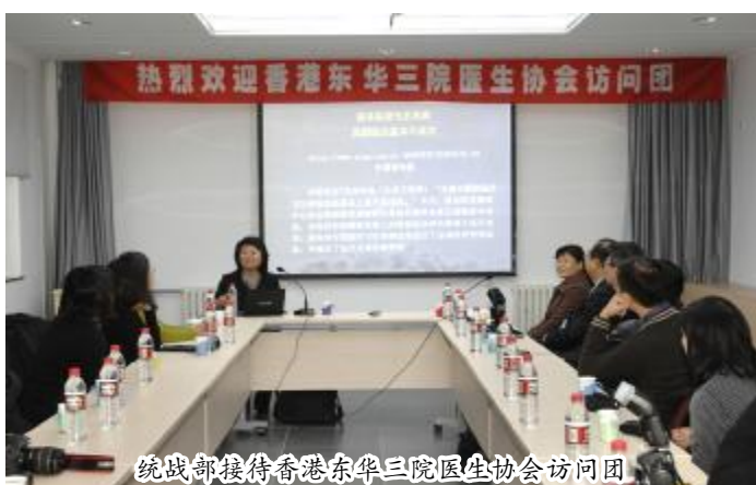
统战部接待香港东华三院医生协会访问团