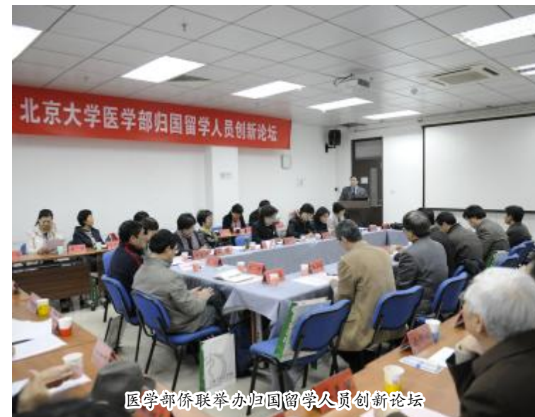
医学部侨联举办归国留学人员创新论坛