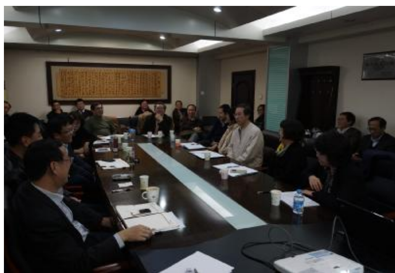
▲公共卫生学院邀请统战人士参与学科发展规划