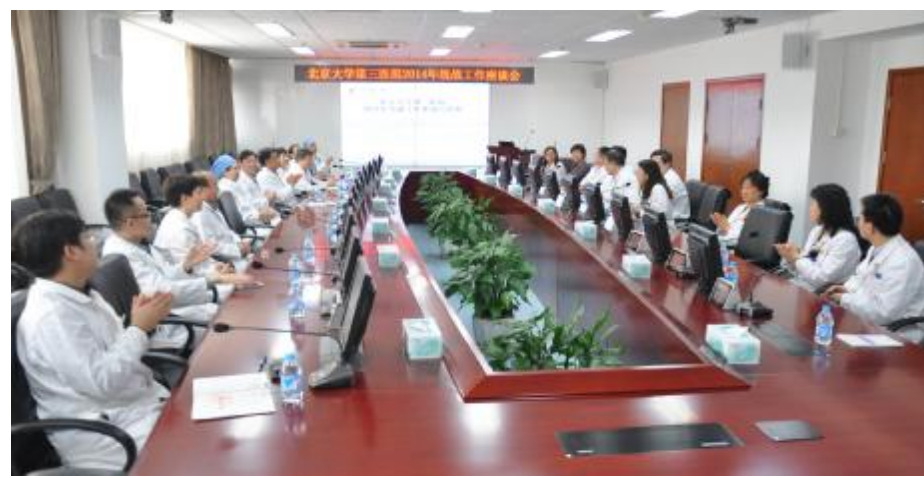
▲第三医院召开统战工作座谈会