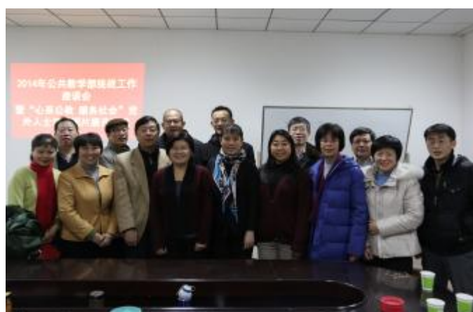
▲公共教学部召开统战工作座谈会