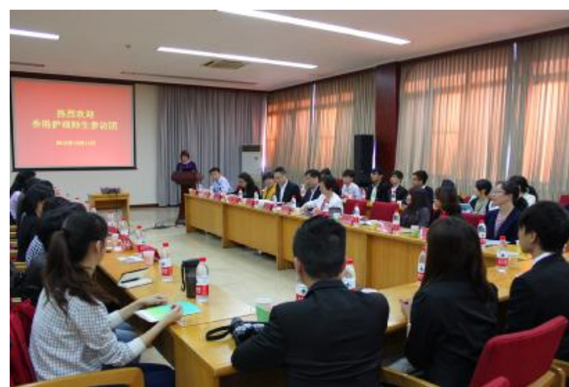
▲护理学院接待香港访问团