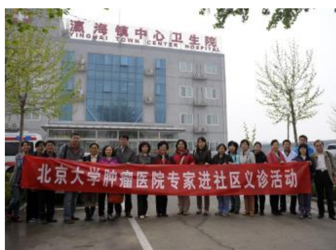
▲肿瘤医院组织统战人士开展社区义诊活动